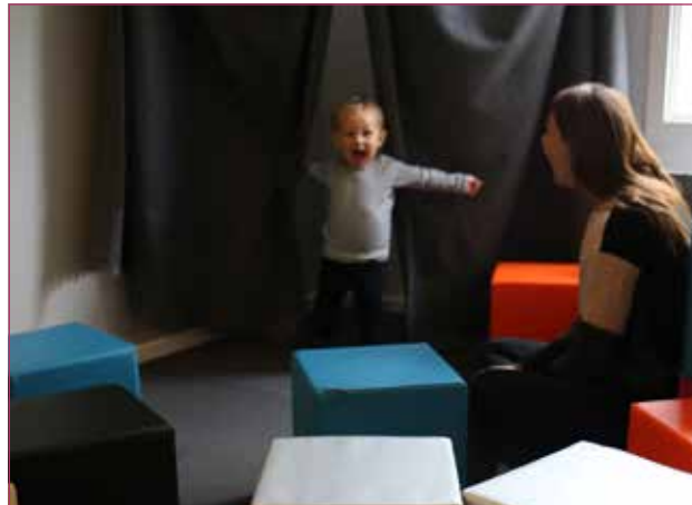
Før var jeg der ikke, nu er jeg her igen; et legemiljø der ligger i tråd med i dette tilfælde vuggestuebarnets udviklingstrin

12. Legemiljøerne bør afspejle forståelse for aldersgruppen