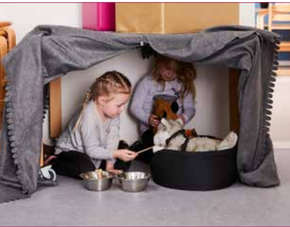
Borde kan være aktive legemiljøer, når de ikke lige bruges til at spise ved

9. Steder hvor man sidder eller står med ryggen til rummet giver god mulighed for fordybelse i legen.